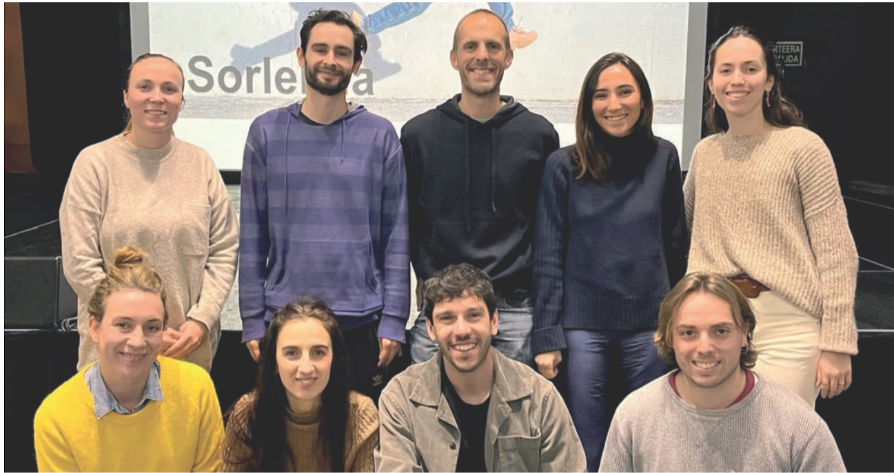
Sorlekua Mentoretza programaren lehenengo deialdiko parte-hartzaileak

Naiara Elgarresta, Elur Etxea, Davidi Dú, Bekoop, Aloka, DAB dantza konpainia, ZirKuSS, Carlavilla Studio, Barandi Producciones eta Los Viajes de Aspasia dira, Kutxa Fundazioaren SORLEKUA MENTORETZA programaren eskutik, Gipuzkoako kultura-agertokia eraldatuko duten hamar proposamen disruptiboak.